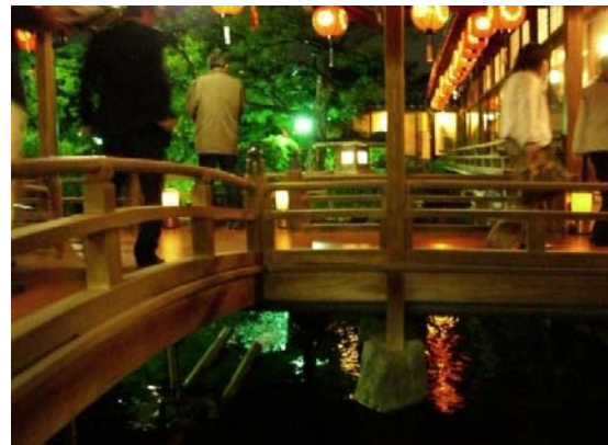
京都市 北野上七軒歌舞練場