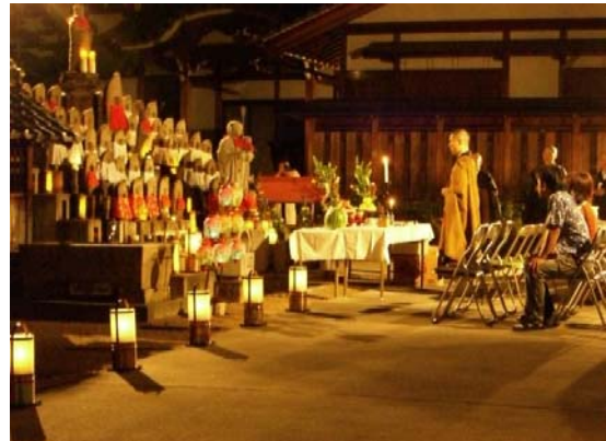
岐阜市 天衣寺 地藏盆