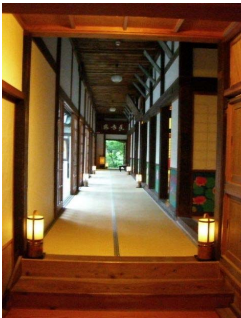
和歌山県由良町 興国寺