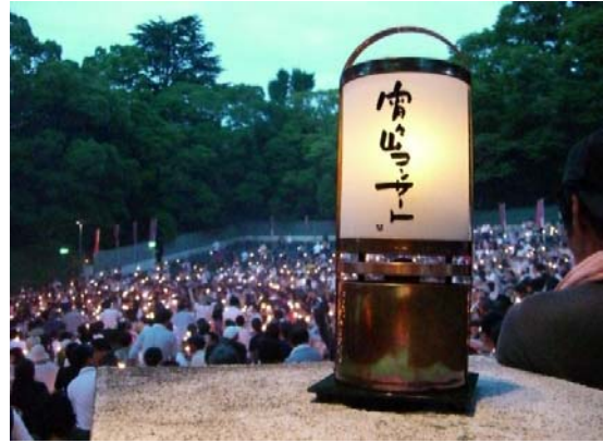
京都市円山公園音楽堂 宵々山コンサート