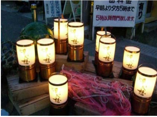
若狭高浜町 漁火想