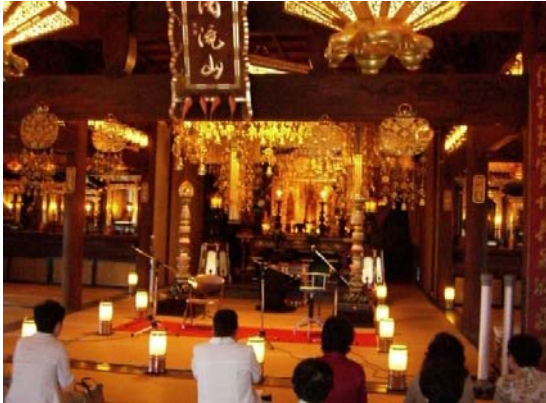
和歌山県有田川町 浄教寺